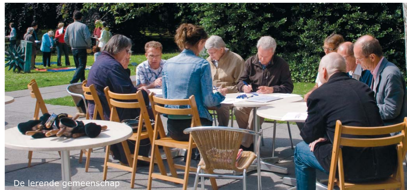
De lerende gemeenschap